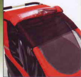
Das Verdeck ist mit Mückennetz und Sonnenblende versehen, wobei hier mehrere Positionen möglich sind.

dienen. Dolphin lässt sich werkzeuglos klein zusammenklappen. Hinter den Sitzen befindet sich ein geräumiger Stauraum. Durch die feste Rückenlehne der Sitze kann der Stauraum voll beladen werden, ohne dass die Rückenhaltung der Kinder beeinträchtigt wird. Die niedrige Anordnung des Stauraums ergibt einen niedrigen Schwerpunkt, was zur Optimierung der Fahreigenschaften von Dolphin beiträgt. Montage von Rückleuchten ist möglich.