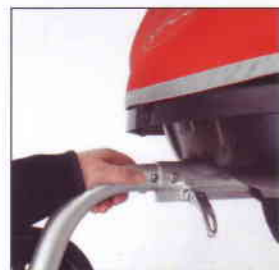
Deichsel und Buggyrad lassen sich mittels einer Knopffeder einfach montieren und mit Schnellspanner festklemmen.