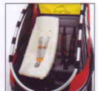
Weber Babysitz Lässt sich in flacher Position sicher befestigen.