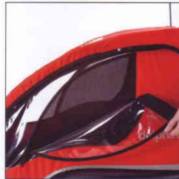
Optimal belüftet Die Seitenfenster lassen sich öffnen. Die Scheibe kann aufgerollt zwischen Netz und Verdeck verstaut werden.