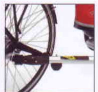
Weber Kupplung E