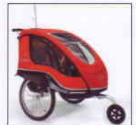
Buggyrad Mittels des Buggyrads lässt sich der Dolphin einfach als Buggy umfunktionieren