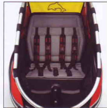
Flexibel und bedienerfreundlich 5-Punkt-Gurtsystem gewährleistet optimale Sicherheit. Gurte, Sitzpolsterung und Taschen sind waschbar.

Ein einzigartiges Produktmerkmal ist außerdem die Verstellbarkeit der Rückenlehne in eine bequeme Ruheposition. Sitze und Gurte sind weich gepolstert. Das flexible 5-Punkt-Gurt-System, gewährleistet optimale Sicherheit im Schulter- und Beckenbereich und die Bedienung ist sehr einfach. Leicht lässt sich jetzt auch ein Kind in der Mitte angurten. An jeder Seite der Kabine gibt es eine große abnehmbare Tasche aus strapazierfähigem Material, die bei max. 40 ° gewaschen werden kann, so wie es mit Gurten und Sitzpolsterung auch der Fall ist.