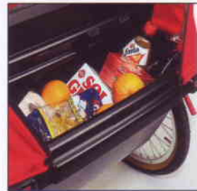
Grosser integrierter Stauraum mit niedrigem Schwerpunkt.