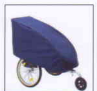
Regenschutz - Garage